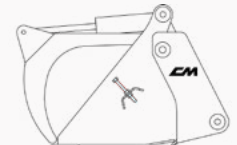
Modelo com kit escovas

O CBS Multi Kit é um varredor 3-em-1. Consiste num varredor articulado concebido para a recolha de detritos de pequenas e grandes dimensões, uma vez que, além de facilitar a descarga a partir de alturas elevadas, permite recolher pedaços de grandes dimensões que seriam impossíveis de recolher apenas com as escovas. Graças a dois ganchos colocados na parte superior é possível eliminar as escovas e ter apenas o balde articulado disponível. Além disso, quando necessário, podem ser aplicados dois braços que transformam CBS MK num balde com pinças para recolher galhos e ramos.