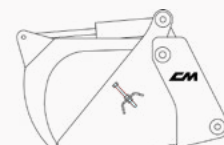
Modèle avec kit brosses